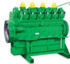
J312 Short Block